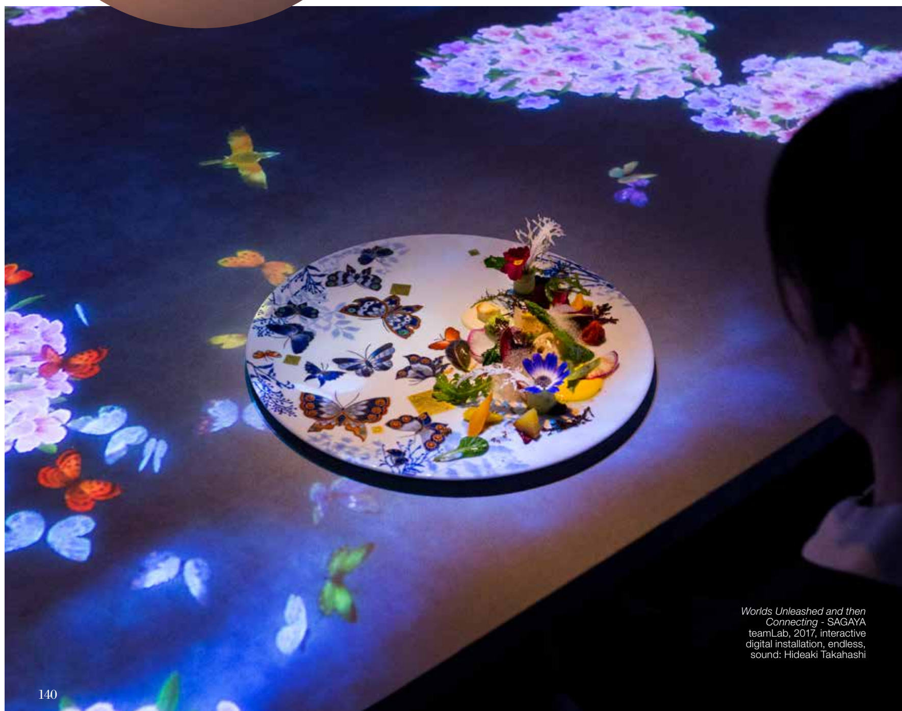
Worlds Unleashed and then Connecting - SAGAYA teamLab, 2017, interactive digital installation, endless, sound: Hideaki Takahashi