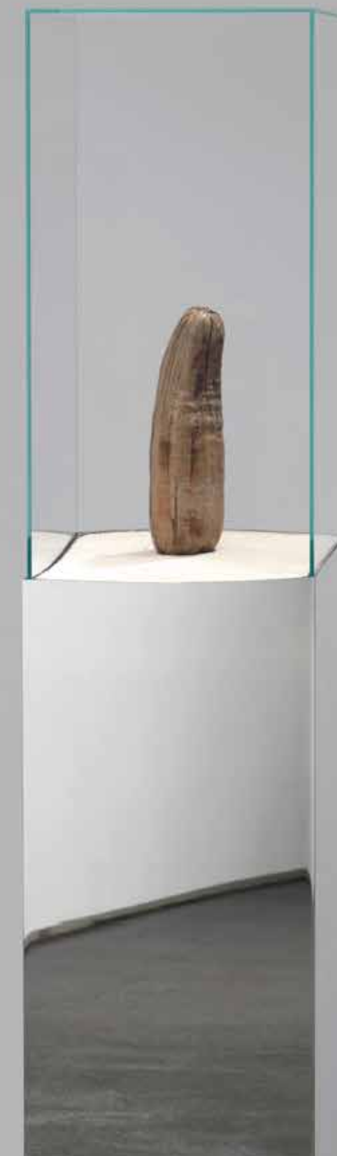
Julian Charrière, Lost at Sea - Bikini-Fragment , 2016, copyright Julian Charrière, VG Bild-kunst, Bonn, courtesy DITTRICH & SCHLECHTRIEM, Berlin